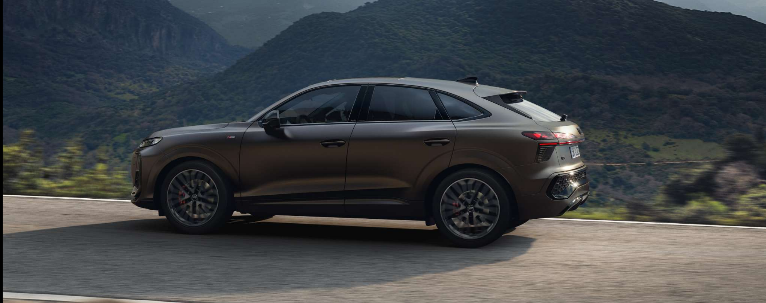
Nuevo Audi Q3 Sportback Dynamic TFSI 110 kW S tronic