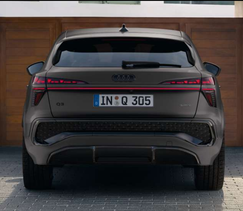
Nuevo Audi Q3 Sportback Dynamic TFSI 110 kW S tronic