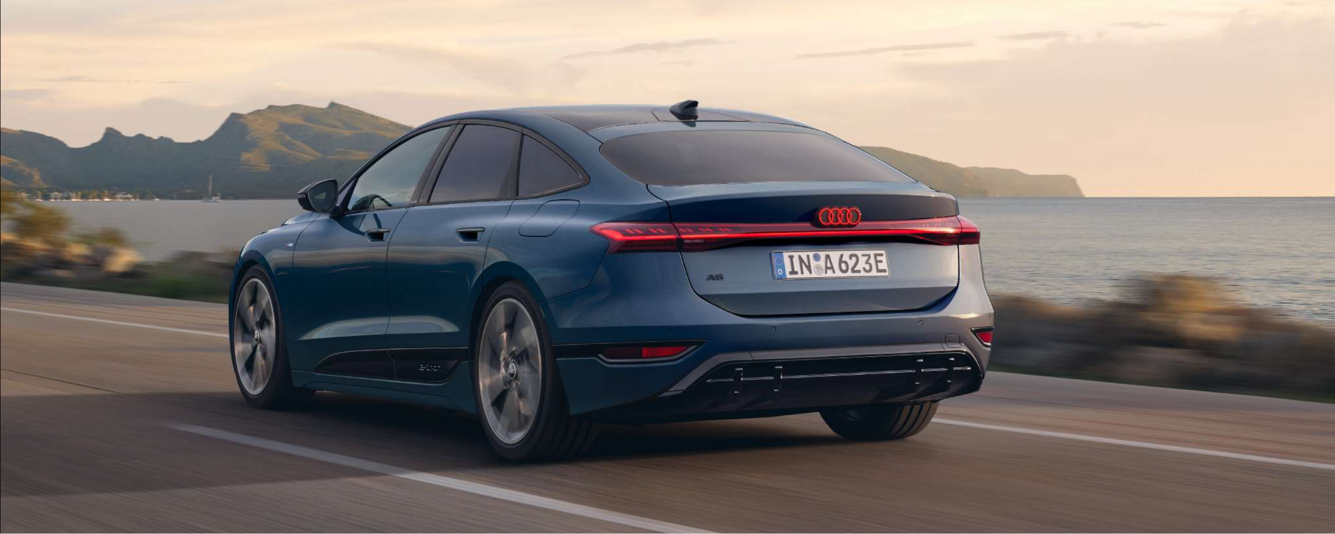
Nuevo Audi A6 Sportback e-tron Advanced 210 kW